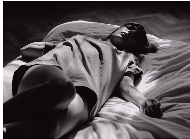
Photo choisie par Alexandra lors de la première rencontre avec les femmes participantes

Les femmes rencontrées expriment bien l'idée que leurs enjeux de santé mentale, parfois ancrés dans les traumatismes de l'enfance, sont surtout exacerbés par les violences et les situations de précarité qu'elles ont vécues et vivent toujours. Les actrices clés abondent dans le même sens : les multiples difficultés vécues par les femmes – la violence, le sentiment d'insécurité, la pauvreté, la recherche constante de stratégies de survie qui alourdit la charge mentale – entraînent des effets importants sur la santé physique et mentale des femmes qui vivent des situations d'instabilité résidentielle ou d'itinérance.